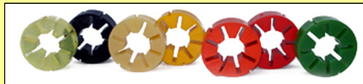
Olika kopplingsband beroende på applikation och miljö.