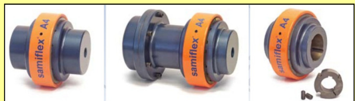
Några vanliga varianter av Samiflexkoppling.

Alla utgivna informationsblad återfinns på hemsidan under fliken "Referenser".