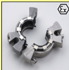
Delade tätningar, även EX-klassade