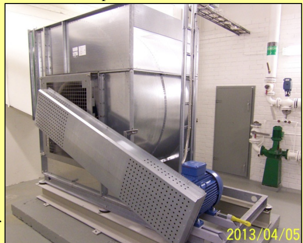
En av två friskluftfläktar på Jakobsbergs sjukhus.

Vänligen meddela oss om du önskar att inte erhålla detta utskick i framtiden.