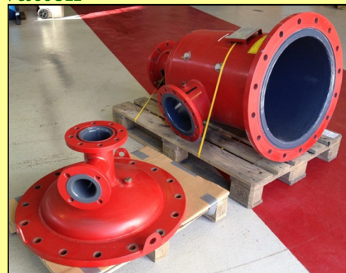
Kompositbelagt filterhus för sjövattnen.

Vi förväntar oss att livslängden efter uppgraderingen skall vara märkbart mycket längre än innan.