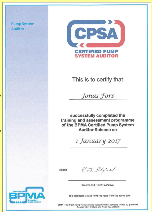
Diplom från godkänd CPSA-kurs hos BPMA (British Pump Manufacturers Association) i januari 2017.